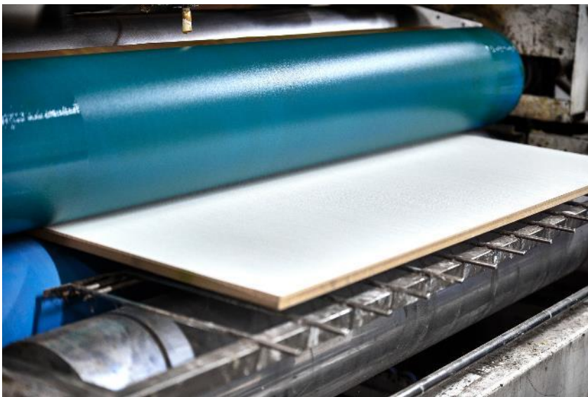
Auftragen der Klebebeschichtung