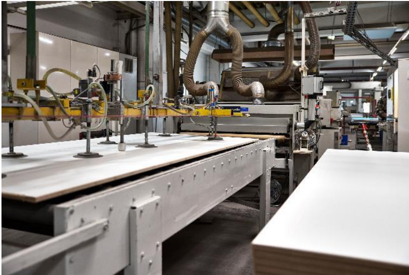
Hotmelt Beschichtungsanlage zur Fertigung von Verbundelementen